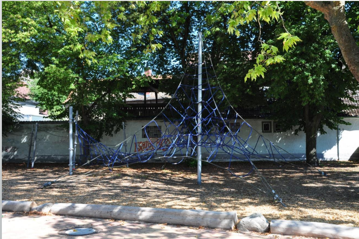
Lindenschule Trebur (Grundschule)