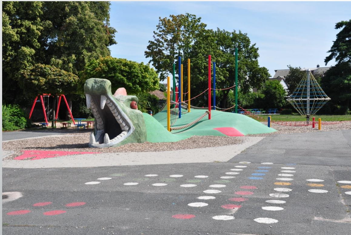
Nibelungenschule Biebesheim (Grundschule)