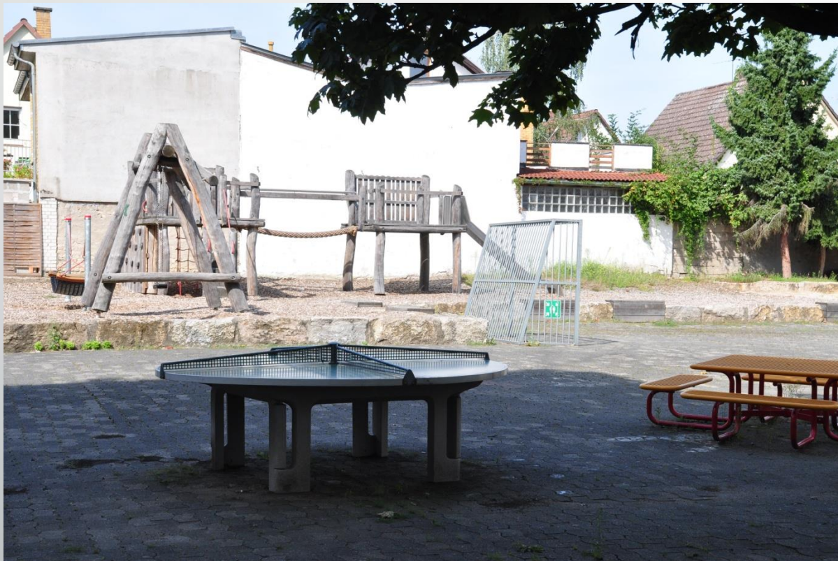
Schillerschule Gernsheim (Förderschule)