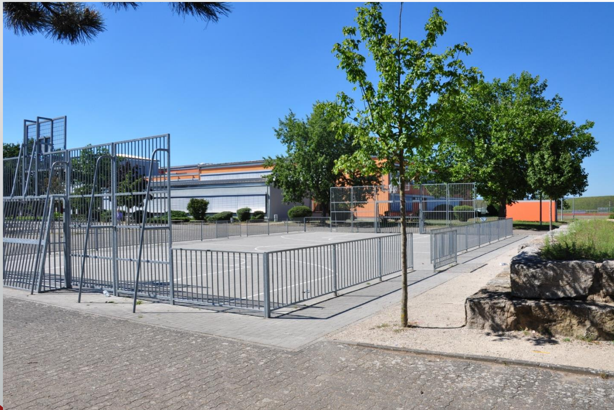
IGS Mainspitze (Integrierte Gesamtschule)