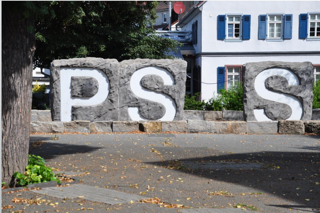
Peter-Schöffers-Schule Gernsheim (Grundschule)