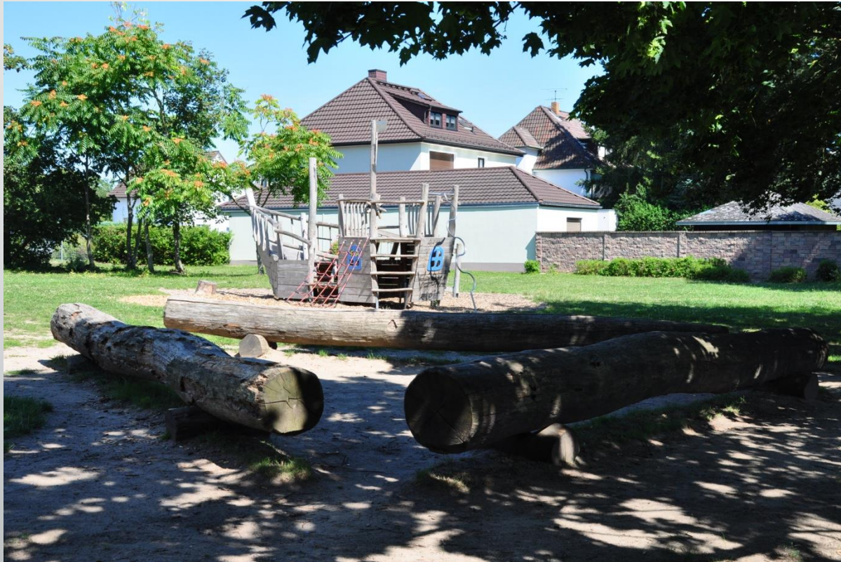
Wilhelm-Arnoul-Schule Walldorf (Grundschule)